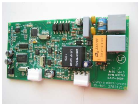
Σχήμα 1 : Κάτοψη πλακέτας BS-465 .

Στην υποδοχή TELEPHONE συνδέουμε όποια άλλη τηλεφωνική συσκευή θέλουμε.