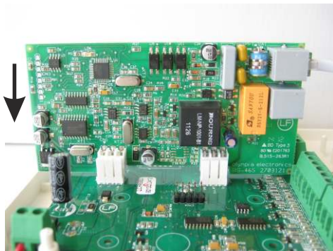
Σχήμα 2 : Τοποθέτηση BS-465 στον πίνακα BS-468