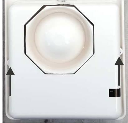
Φωτογραφία 2. Εσωτερικό κάλυμμα.