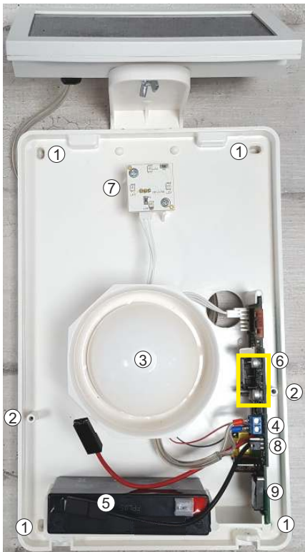
Φωτογραφία 3 Τα κύρια μέρη της σειρήνας