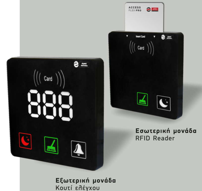
Εξωτερική μονάδα Κουτί ελέγχου

Επίσης, εξαλείφει την ανάγκη για εξωτερικές πινακίδες, καθιστώντας τη διαδικασία πιο απλή και οικονομικά αποδοτική, ενώ διασφαλίζει τη μακροχρόνια ανθεκτικότητα των σημάνσεων.