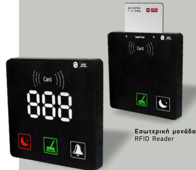
Εσωτερική μονάδα RFID Reader

Επίσης, εξαλείφει την ανάγκη για εξωτερικές πινακίδες, καθιστώντας τη διαδικασία πιο απλή και οικονομικά αποδοτική, ενώ διασφαλίζει τη μακροχρόνια ανθεκτικότητα των σημάνσεων.