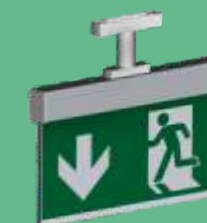
A-1143 * Deckenmontage