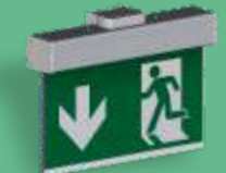
A-1134 * Wandmontage