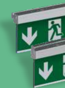
A-1140 & A-1141 ** Wand- oder Deckenmontage