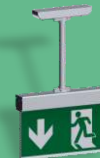
A-1130 ** Pendelmontage