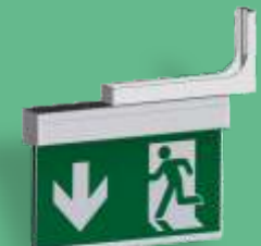
A-1133 ** Wandausleger