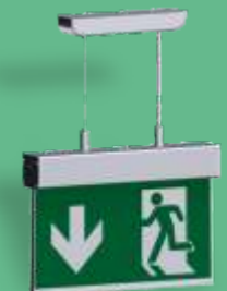
A-1136 ** Hanging mounting