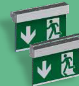
A-1140 & A-1141 ** Wand- oder Deckenmontage