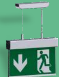
A-1136 ** Hängende Montage