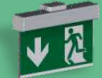
A-1134 * Wandmontage