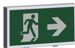
Montaggio a parete