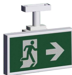
A-2143 * Montaggio a soffitto