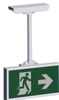
A-2130 * Montaggio a soffitto

I componenti sono disponibili in colore antracite. * disponibile su richiesta