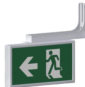
A-2133 * Montaggio a bandiera