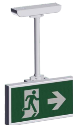
A-2130 * Σε οροφή