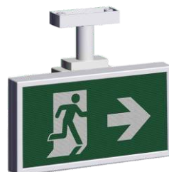
A-2143 * Σε οροφή