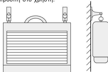
Κρέμασμα από τον τοίχο με τη χρήση των ειδικών πλαστικών στηριγμάτων και των κρίκων.